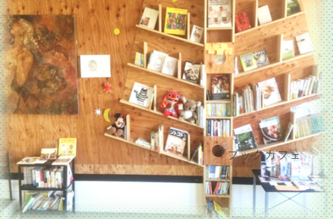
MIRAI + mirai Project 2017