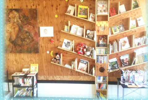
MIRAI + mirai Project 2017